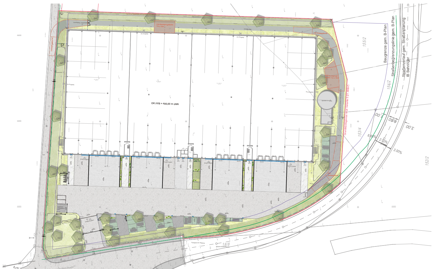
FREIFLÄCHENPLAN O. M.